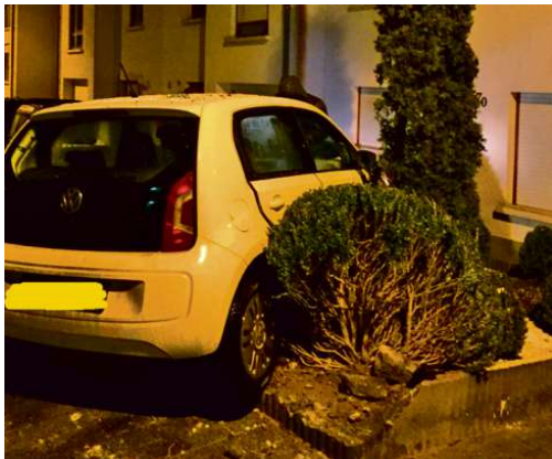
Trois voitures se sont encastrées dans un jardin en quelques heures.

La nuit a également été agitée sur l'A1, à hauteur de la sortie Flaxweiler. Plusieurs accidents - n'ayant pas fait de victimes - ont eu lieu à quelques heures d'intervalle en raison du givre sur la chaussée. Entre Filsdorf et Altwies, un autre véhicule a été victime du verglas. La passagère a été conduite à l'hôpital. D'autres accidents sans gravité ont été signalés à Schwebsange, Niederanven et Mondorf.