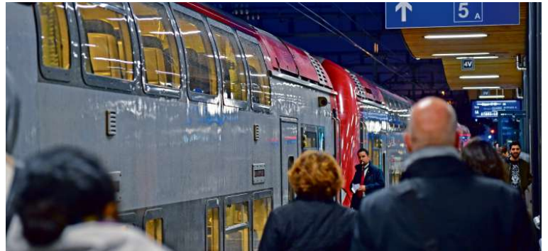
Les trains et les bus, premiers transports à devenir gratuits pour les étudiants, en attendant le tram.

Pour bénéficier de cette mesure, les jeunes pourront demander une mKaart gratuite et